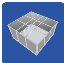
SISTEMA DE TIRANTES

As placas são fabricadas em poliéster reforçado com fibra de vidro (PRFV), material leve e de fácil manuseio, proporcionando uma economia considerável na estrutura e fundação, principalmente em se tratando de reservatórios superiores, assim como otimização do tempo de construção, evitando formas, ancoragem e espera do tempo de cura.